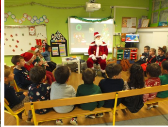
Visite du Père-Noël à l'école maternelle Edmond Marquis le 15 décembre 2023.