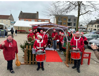
Marché de Noël de L'Union des Commerçants et Artisans de Camon le samedi 23 décembre 2023.