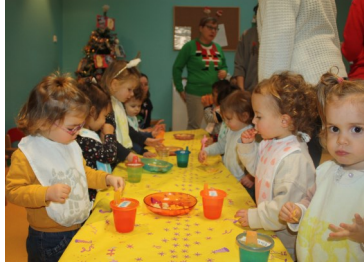
Noël des Caminoux 2023.