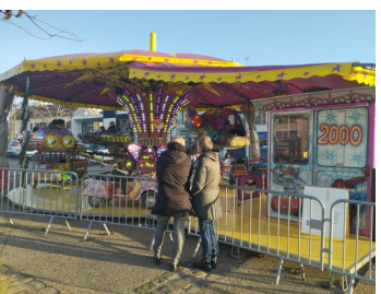
Manège offert par la Municipalité Du 22 décembre au 29 décembre.