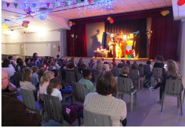
Spectacle de fin d'année des écoles maternelles et élémentaires avec distribution de friandises.