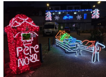
Village de Noël 2023.