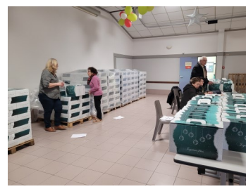
Distribution de colis de Noël aux aînés et aux demandeurs d'emplois les 04 et 05 décembre 2023.