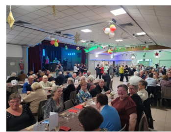
Repas de Noël des aînés le 03 décembre 2023.